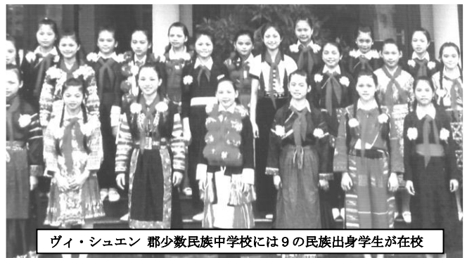
ヴィ・シュエン郡少数民族中学校には9の民族出身学生が在籍

対象となるVi Xuyen郡少数民族中学校（4年制）では全校250人中34%が貧困家庭に属しています。ベトナム政府による貧困基準は1人当たり月平均収入400,000VND≒約2000円（ベトナム、農村部）以下で、2015年段階では農村部の17.4%（ベトナム全土）が該当しますが、ハザン省の対象中学校はこれより大幅な貧困率となっています。