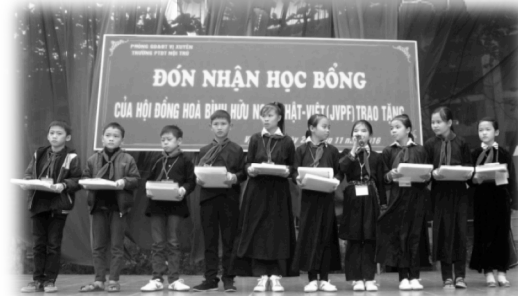
第一期奨学金贈呈の様様：ヴィ・シュエン 郡少数民族中学校で 2016 年 11 月 26 日