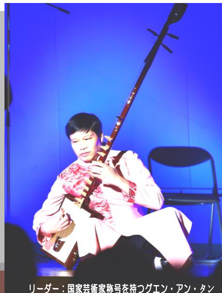
リーダー：国家芸術家称号を持つグエン・アン・タン