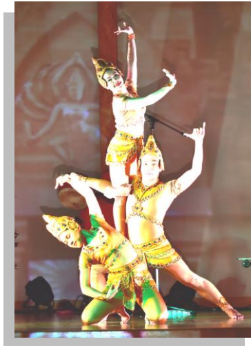
少数民族 ” チャム族の踊り”