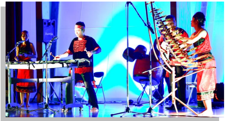
石楽器” ダンダ” (左端) と竹 楽器” トルン” (右端) の演奏

I F C C 国際友好文化センター 〒62-0801 東京都新宿区山吹町333番地 辻ビル405 TEL 03-3268-4387 FAX 03-3268-6079 E m a i l : jvccpf@rmail.plala.or.jp 日本ベトナム平和友好連絡会議 ( J V P F )