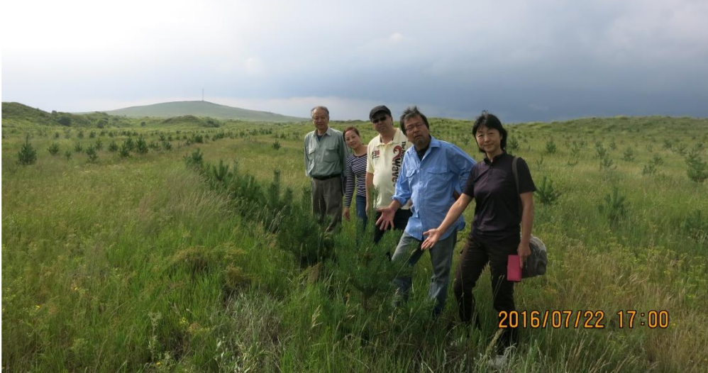
内モンゴル・滦河源第二期事業地 16・7・22