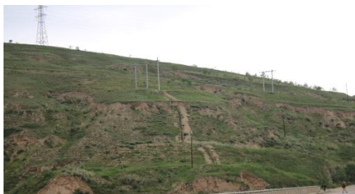
日中青年寧夏固原市生態緑化モデル林