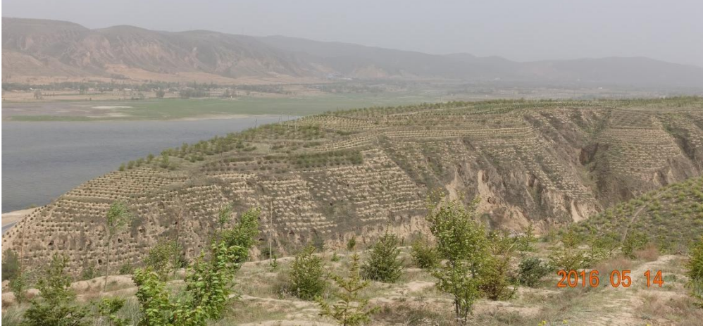
寧夏・固原市事業実施地・全景 16・5・14