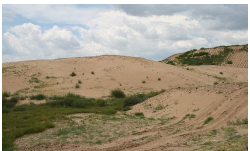
蒙京津冀青少年生態緑化モデル林プロジェクト